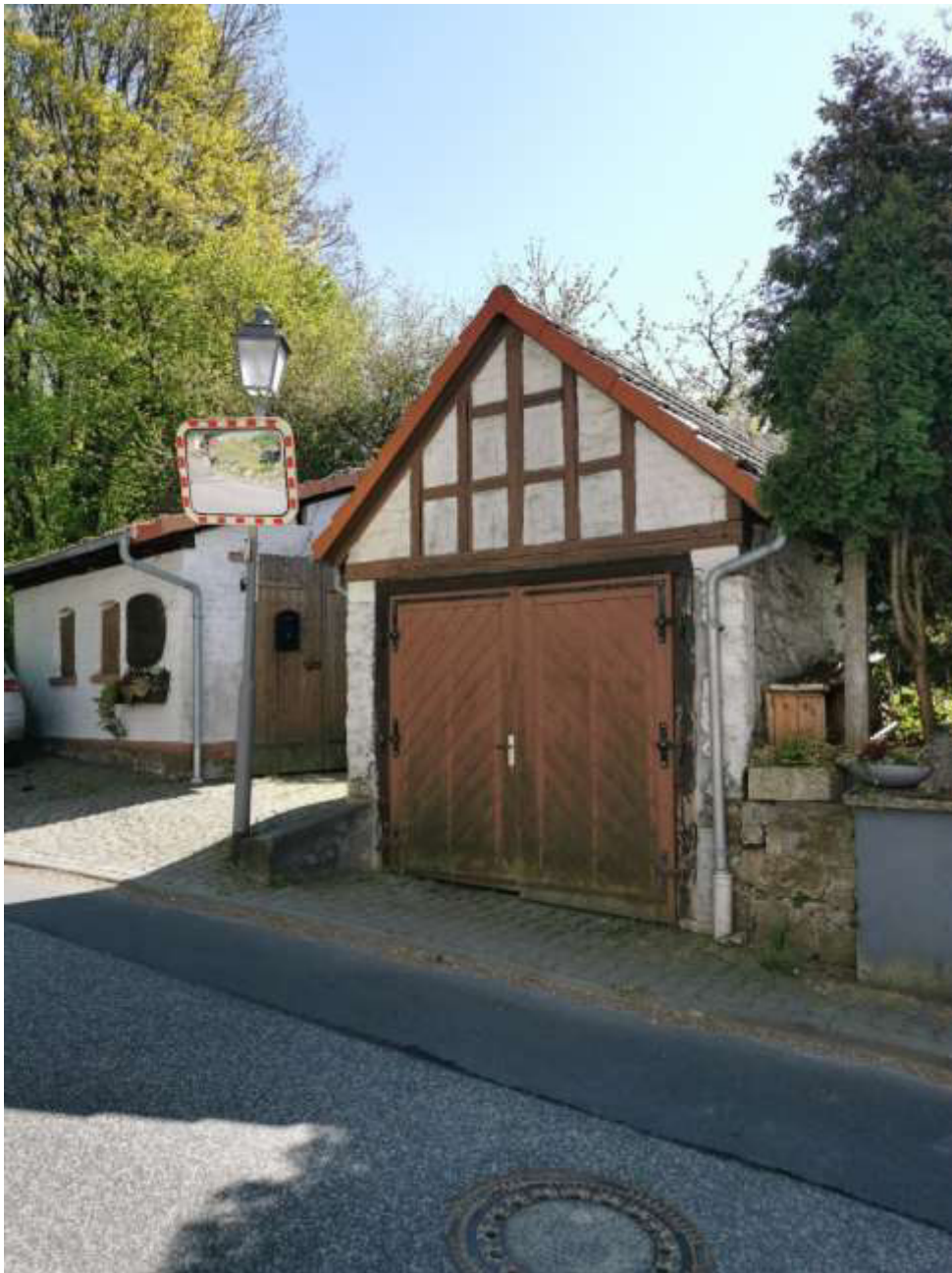
Ortsstraße ohne Nummer, in 65510 Idstein-Lenzhahn